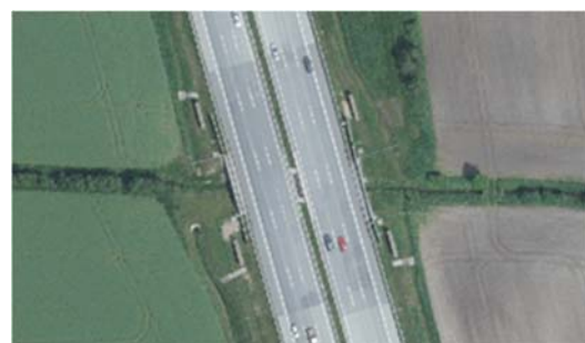
Abb. 1: Wölfe in Unterführungen Wölfe (C3-Nachweis) beim Queren der A7 in SH auf der Berme einer Gewässerunterführung; Fotos: Wolfsbetreuer Schleswig-Holstein / Wolfgang Springborn sowie Umweltportal SH